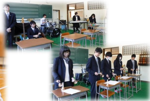
1,2年選択科目音楽 授業発表会の様子。写真は1年生です。