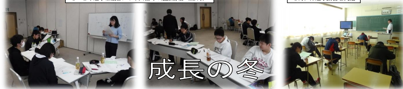
1月には進学講習も実施