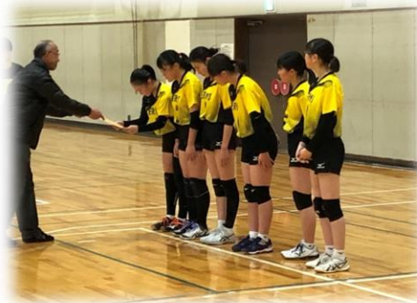
新たなチームで発進!

応援していただいた皆様ありがとうございました。3年生引退後、2年生の新人部員も加入し、今後さらにパワーアップが期待されます。これからもよろしくお願ひします。