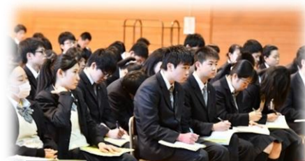
真剣に話を聞き、メモを取る1、2年生