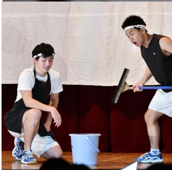
3年生渾身のコント！会場は笑いの渦に！さすが！！