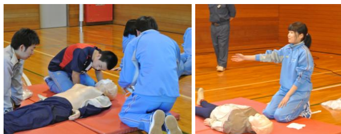
【昨年の救命講習の様子】